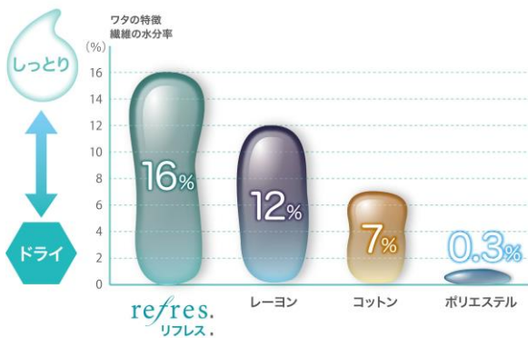
繊維の水分率の比較