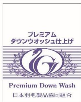
プレミアムダウンウォッシュ仕上げ認定ラベル