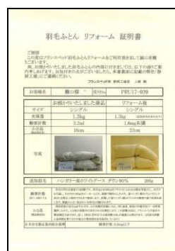
羽毛リフォーム証明書