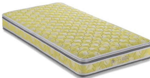
「VI-100W」(ウォッシュブルタイプ)