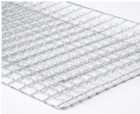
高密度連続スプリング