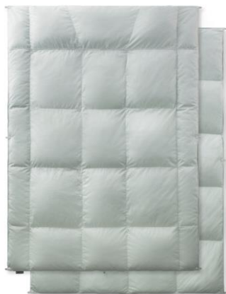
「AS キュリエス・エージー95」