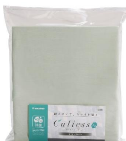
マットレスカバー