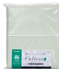
新商品 掛けふとんカバー