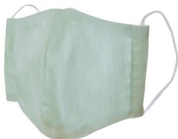
「キュリエス・エージー 立体マスク」