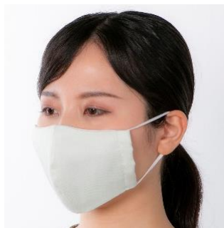
「キュリエス・エージー 立体マスク」