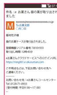
服薬情報をメールで共有