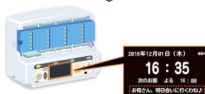
機器にメッセージを送信可能