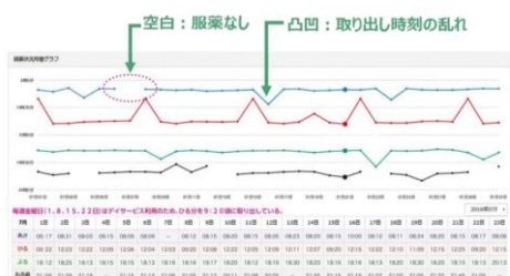
薬の取り出し記録を一覧表で表示