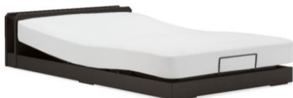
「UD-102C」(マットレス別売り) 低床仕様、レッグタイプ(レッグ取り外し時)