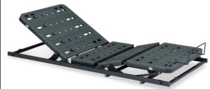
薄型電動リクライニングユニット「TRG31」

※フランスベッド製品以外のベッドフレームにのせないで下さい。事故・故障の原因となります。