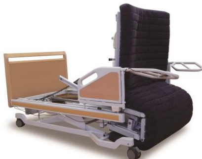
介護ベッド「離床支援 マルチポジションベッド」