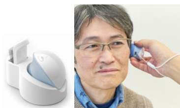
聴こえのサポートツール 「a-tell」

【住所】〒169-0075 東京都新宿区高田馬場 1-31-16 ワイム高田馬場ビル 1F