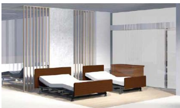
ショップイメージ

本ショップはこれまで、「リハテックショップ新宿店」として、主に介護保険を利用した福祉用具のレンタルおよび販売を行ってきました。今回のリニューアルでは、「介護のため」だけではなく、これからも無理なく快適に暮らし続けるための選択肢を提案するショップへと役割を広げます。介護保険制度を利用したレンタルのほか、介護保険を利用しない商品の購入にも対応し、専門スタッフが、一人ひとりの身体状況や住環境に合わせて無理のない選び方や使い方をご案内します。