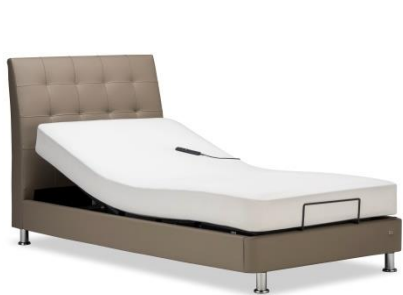
電動ベッド「IQ アッシュフォード」