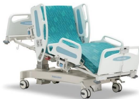
見守りケアシステム M-2 内蔵ベッド FBD-N936