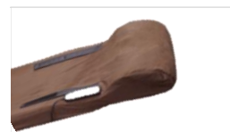
④ラミダス本体カバー