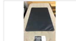
⑦ラミダスアンダーボード ※ベッドの上で使用の際に設置