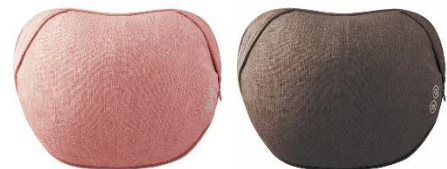
カラーはピンクとブラウンの 2 色