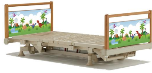
スーパーショートタイプ 「FBN-R20SS・DINO・24N」(2 モーター)