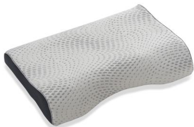
LT ショルダーフィットピロー(ミディアムソフト)