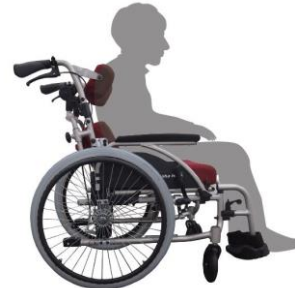
「マルチフィット車いす」