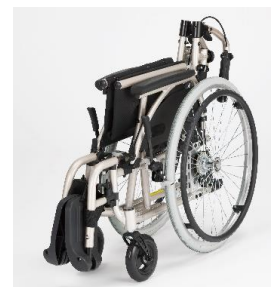
ランバー(腰)サポートとショルダー(肩)サポートを取り外して折り畳みが可能