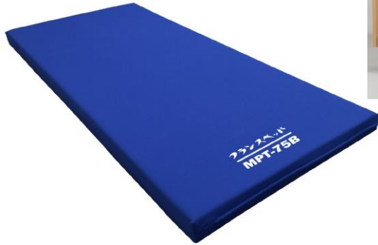
制菌撥水、透湿防水カバー