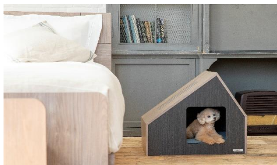
ペットハウス ソフィタ inn

フランスベッド株式会社(本社:東京都新宿区、代表取締役社長:池田茂)では、同社のペット用品ブランド『フランスペット』より、インテリア性の高いペットベッドやペットハウスなど、ペット用家具計4点を2021年11月上旬より発売いたします。