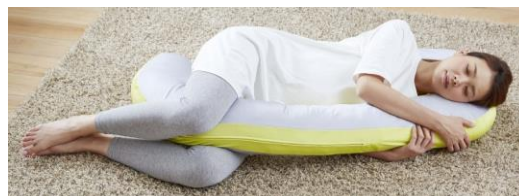
授乳クッションや抱き枕としての活用も可能