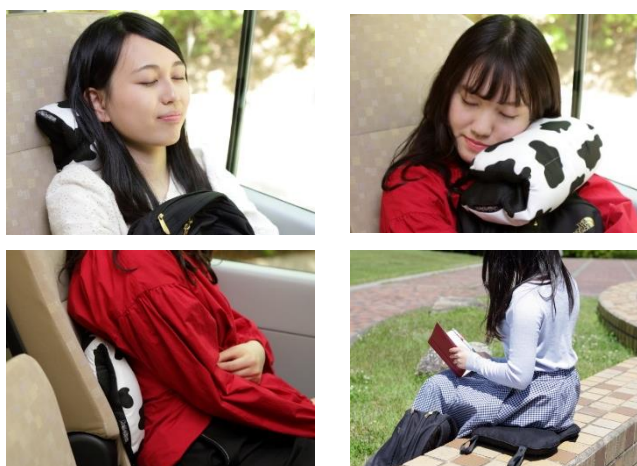
折り畳んでまくらやクッションとして使用可能