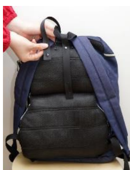
リュック上下の3カ所で固定