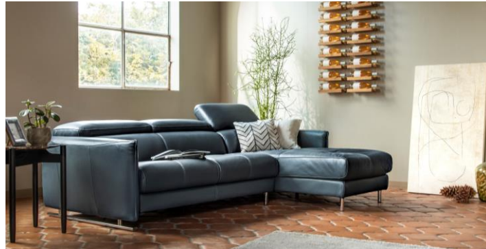
APR-037 シェーズロング (カラー:ARDESIA3071)