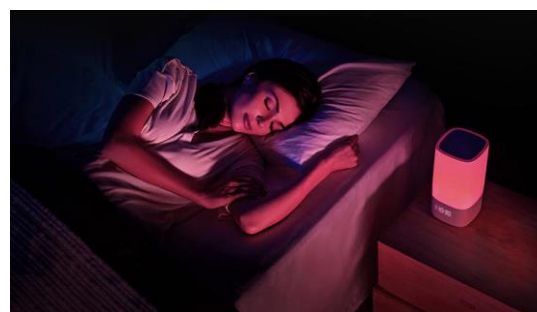
入眠時のイメージ