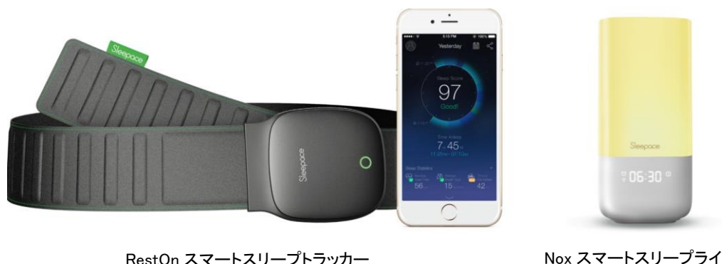
RestOn スマートスリープトラッカー