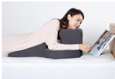
うつぶせスタイル