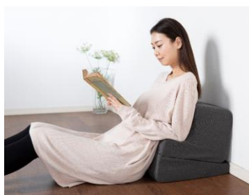
折りたたんで背もたれとしても使用可能