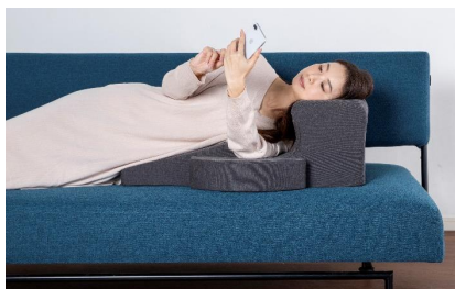
横向き寝スタイル