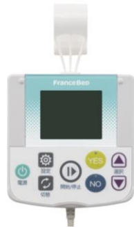
設定コントローラ